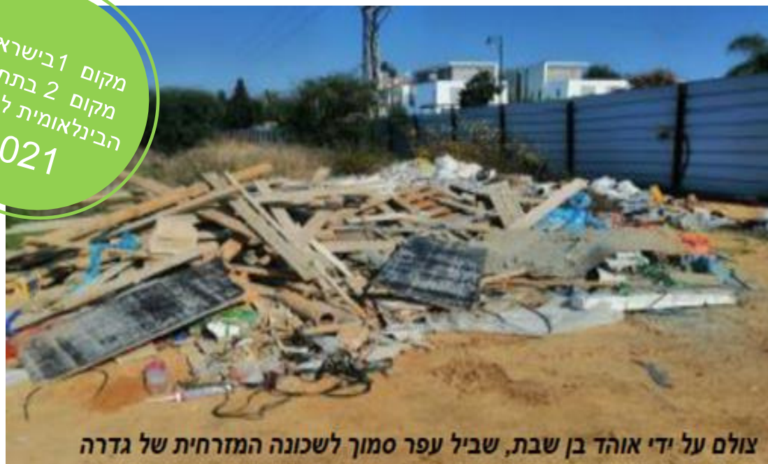
שביל עפר סמוך לשכונה המזרחית של גדרה

מקום 1 בישראל, מקום 2 בתחרות הבינלאומית לכתבות 2021